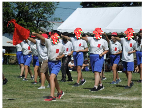
工夫を凝らした応援合戦

今年の応援合戦は、成績をつける競技としました。どのブロックも練習時間が少ないながらも、歌や振り付けに工夫を重ね、ユニークな応援ができていました。全学年そろっての応援だったら、どんなに迫力があつたらうと感じたところです。